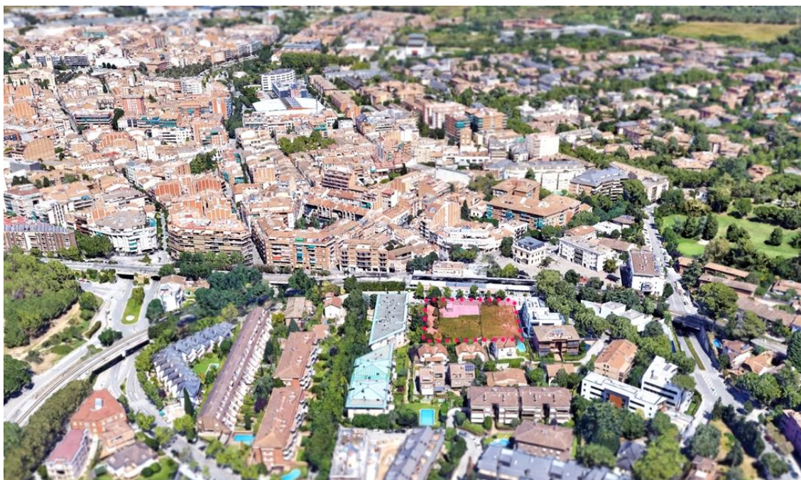
Imatge aèria amb la localització de l'àmbit de reordenació de la MPGM

L'àmbit d'aquesta MPGM són les finques situades al carrer Andana números 1-3 que són propietat municipal. Aquestes finques es troben a l'oest de l'estació del centre dels Ferrocarrils de la Generalitat de Catalunya.